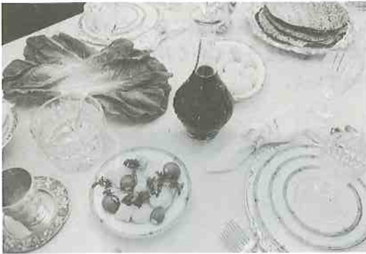
15 過越しの祭で出されるユダヤ料理

case being the Old Testament of the Bible. The Bible contains many important rules and prohibitions laid down by God for the Jews to follow, including rules concerning food and drink. When Orthodox Jews 6 who observe Jewish dietary laws 7 come to Japan, they fall into despair. In Japan, it is difficult for them to find the foods that they 5 are allowed to eat. There are, of course, almost no Jewish restaurants in Japan. Jews can only eat fish with scales 8 , and the fish has to be wrapped in aluminum foil and grilled